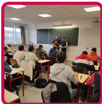
Concours vidéo Marmilhat 12/11