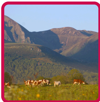
Concours Photo 13/09 -