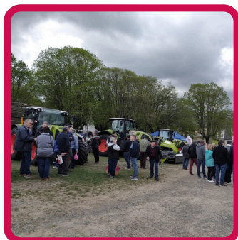
Foire GIAT 15/04