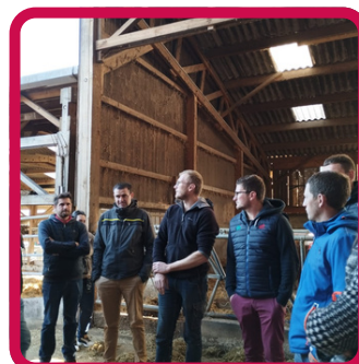
Visite exploitation 17/06