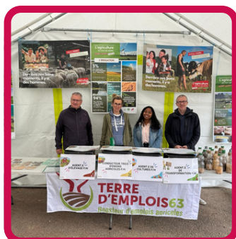
Tour Dauphiné 2/06