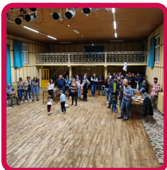
Repas bénévoles 24/10