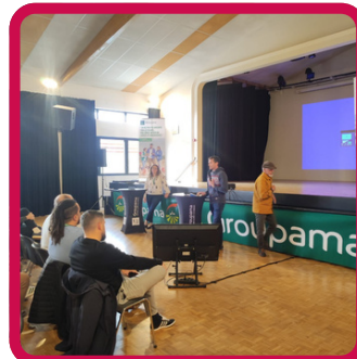
Pass installation Groupama 7/11