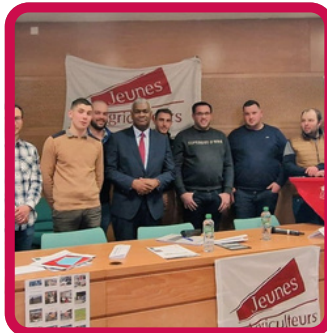
AG avec le préfet 23/02