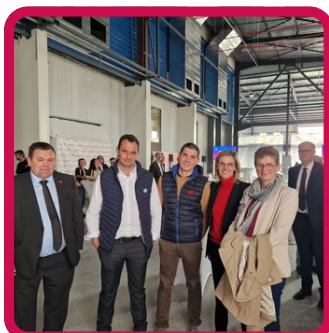
Rencontre Agnès Pannier- Runacher 08/04