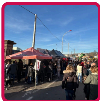
Sainte Paule 27/01