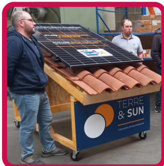
Intervention Solaire Terre et Sun 07/11