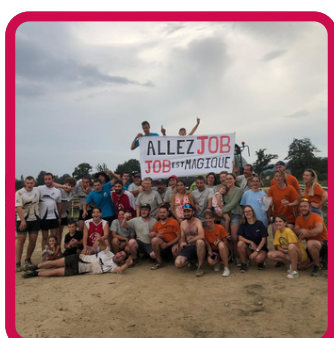
Intervillage Ambert 24/08