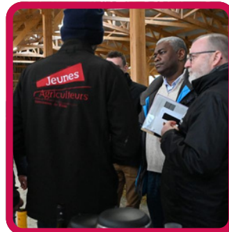
5 rencontres avec le préfet du 22/01 au 24/02