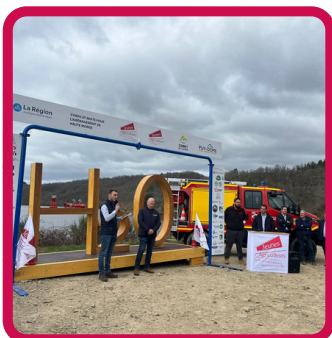
Trail H2O 16/03