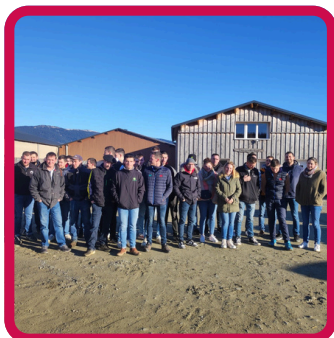
Journée Cohésion 2024