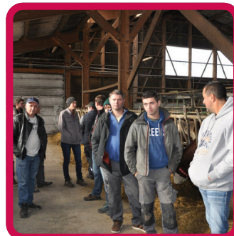
9 Journées à thèmes