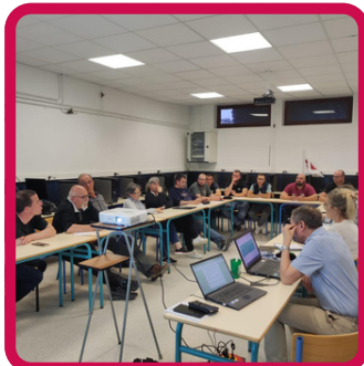
6 Réunions terrains