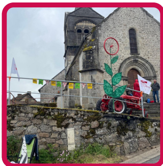
Foire Augerolles 28/09