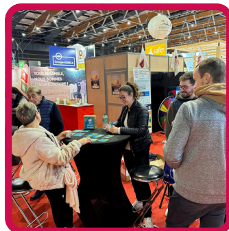
Sommet élevage 1-4/10