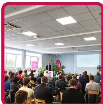
intervention JA - Vet Agro 15/03